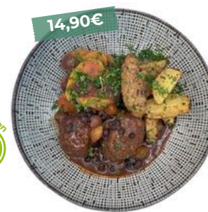
Boulets à la liégeoise