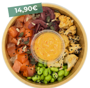
Bon bowl à la truite Gravlax