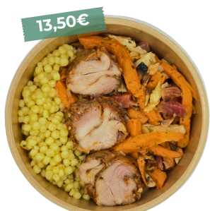
Bon bowl au poulet tango