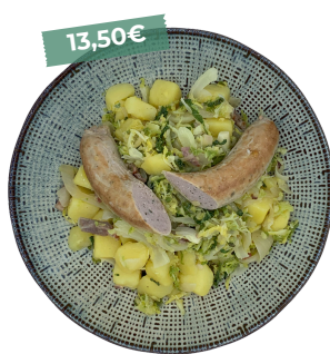
Potée au chou