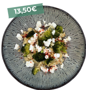
Risotto chèvre brocoli