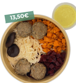
Bon bowl au boeuf teriyaki