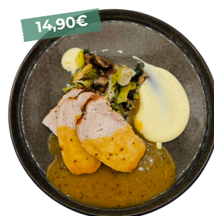
Carré de porc miel moutarde