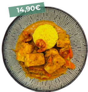
Curry de poisson