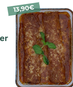
Cannelloni viande, ricotta & épinards