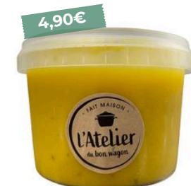
Soupe du moment